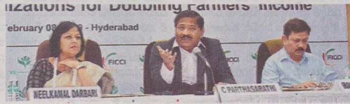
రెడ్ హిల్స్ లోని ఫ్యాషిన్ భవన్ లో ఫిక్సీ, ఏపీకాడిఏ సదస్సులో ప్రసంగిస్తున్న పార్థసారథి

హైదరాబాద్, సమస్త తెలంగాణ, తెలుగుయూని వర్మిటీ: చిన్న, సన్నకారు రైతులు ఎదుర్కొంటున్న సమస్యలను పరిష్కరించి, వారి ఆదాయాన్ని రెట్టింపు చేసేందుకు రైతు ఉత్పత్తి కేంద్రాలు (ఎఫ్పీవో)లు ఎంతో ఉపయోగపడతాయని వ్యవసాయ, సహకారశాఖ ముఖ్యకార్యదర్శి సీ పార్థసారథి తెలిపారు. 2022 నాటికి రైతుల ఆదాయాన్ని రెట్టింపు చేయాలన్న కేంద్ర ప్రభుత్వ పిలుపు మేరకు రైతు ఉత్పత్తి సంస్థలను ప్రోత్సహించేందుకు ఎస్ఎఫ్ఎస్సీ, ఫిక్సీ చేస్తున్న కృషి అభినందనీయమని అన్నారు. శుక్రవారం రెడ్ హిల్స్ లోని ఫ్యాషిన్ భవన్ లో